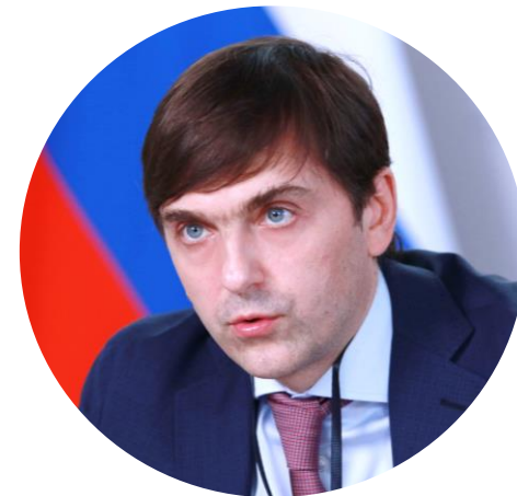
С.С. Кравцов, министр просвещения РФ

бизнеса и предприятий войти в систему образования, в колледжи. Отраслевые специалисты должны сами участвовать в подготовке кадров. Мы готовы дать предприятиям возможность формировать программы под свои запросы, быть соучредителем, а не только спонсорской поддержкой»